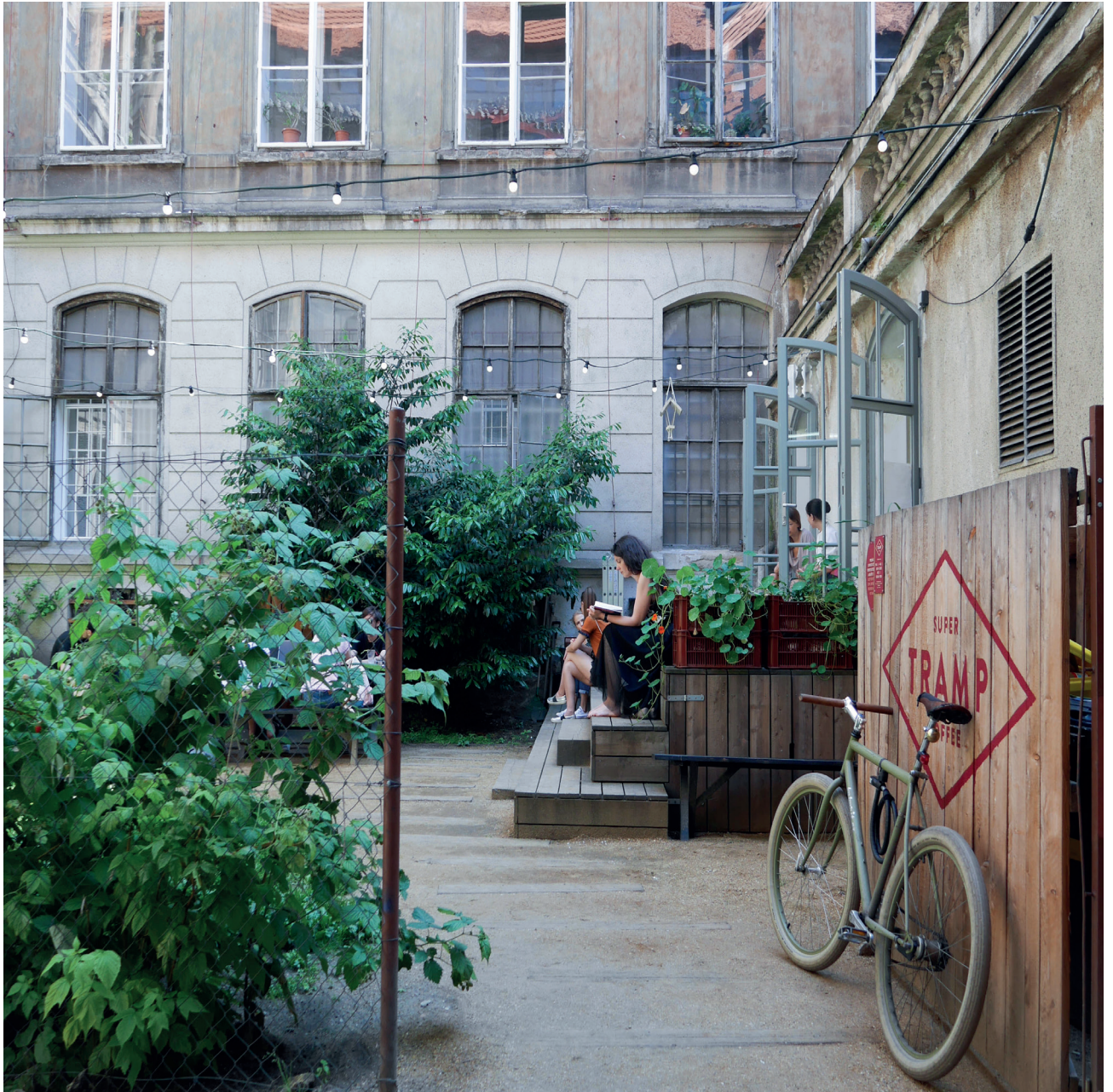
SUPER TRAMP COFFEE @HUGOKATSUMI