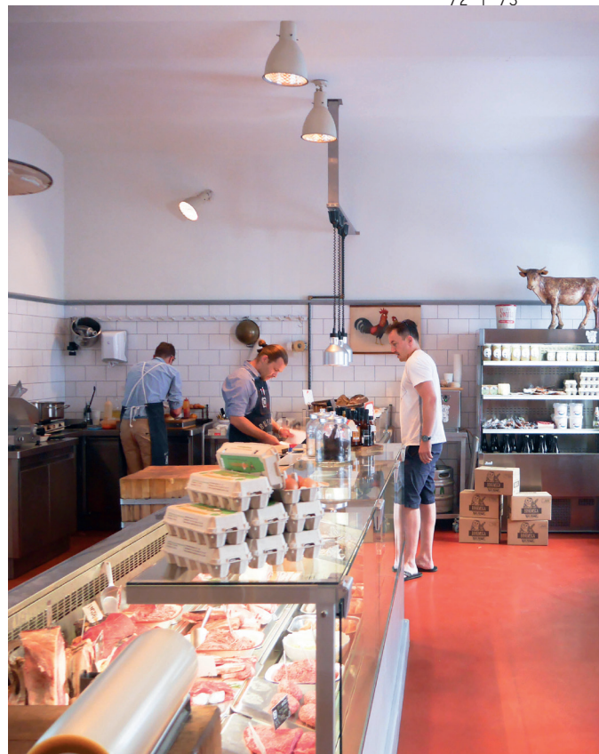
THE REAL MEAT SOCIETY @HUGOKATSUMI

€€ / NÁPLAVNÍ 2011/5 #THEREALMEATSOCIETY