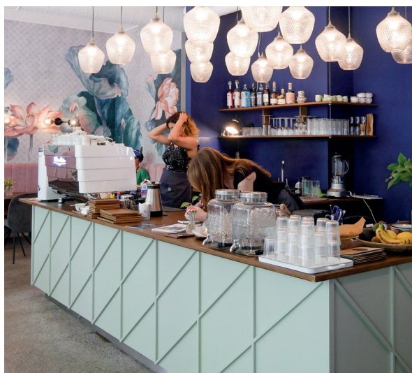
CÀ PHÊ @HUGOKATSUMI

Re-rewind! When the crowd say Bo Bo Bo Bohemia. Time for a turn in the jewel of central Europe: intoxicating Prague. The tourist gem, the beauty of a hundred spires, a labyrinth of narrow streets with super-instagrammable pastel facades, we relish every moment. Take a stroll along the Vltava, cross the Charles bridge to the castle, the Slavic charm works a treat. In the country of Kafka and Herzigova, you'll find hip cafes with charming chicks, in the Eva mould, and handsome Czech guys getting their fill of Pilsner on the patios. We ventured from the secret nooks of the old town to the new quarters, from Letná to Mala Strana, Vinohrady to Holesovice. And we checked out the top Czech spots. Without ringing out our cheque (!) books. So how about a Prague plan?