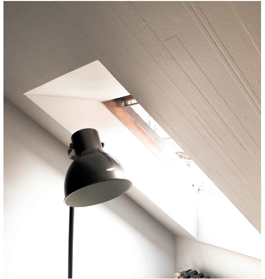
MISS SOPHIE'S @HUGOKATSUMI