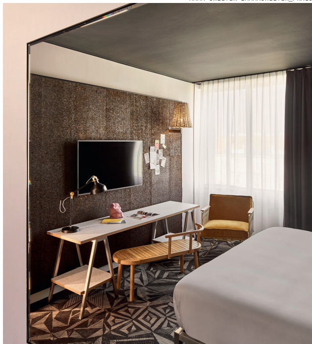
MAMA SHELTER @MAMASHELTER_PRAGUE