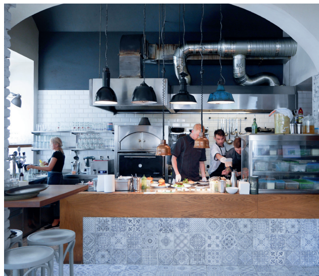
NEJEN BISTRO @HUGOKATSUMI