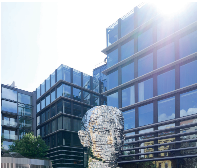
FRANZ KAFKA PAR DAVID CERNÝ