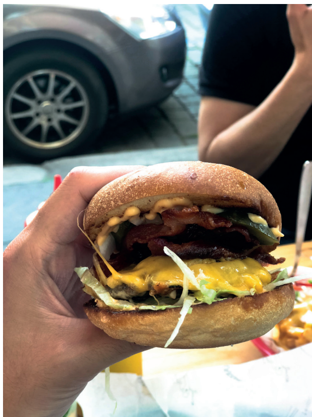
MR. HOTDOG @HUGOKATSUMI

€ / VELETRŽNI 1502/20 @MAMASHELTER_PRAGUE