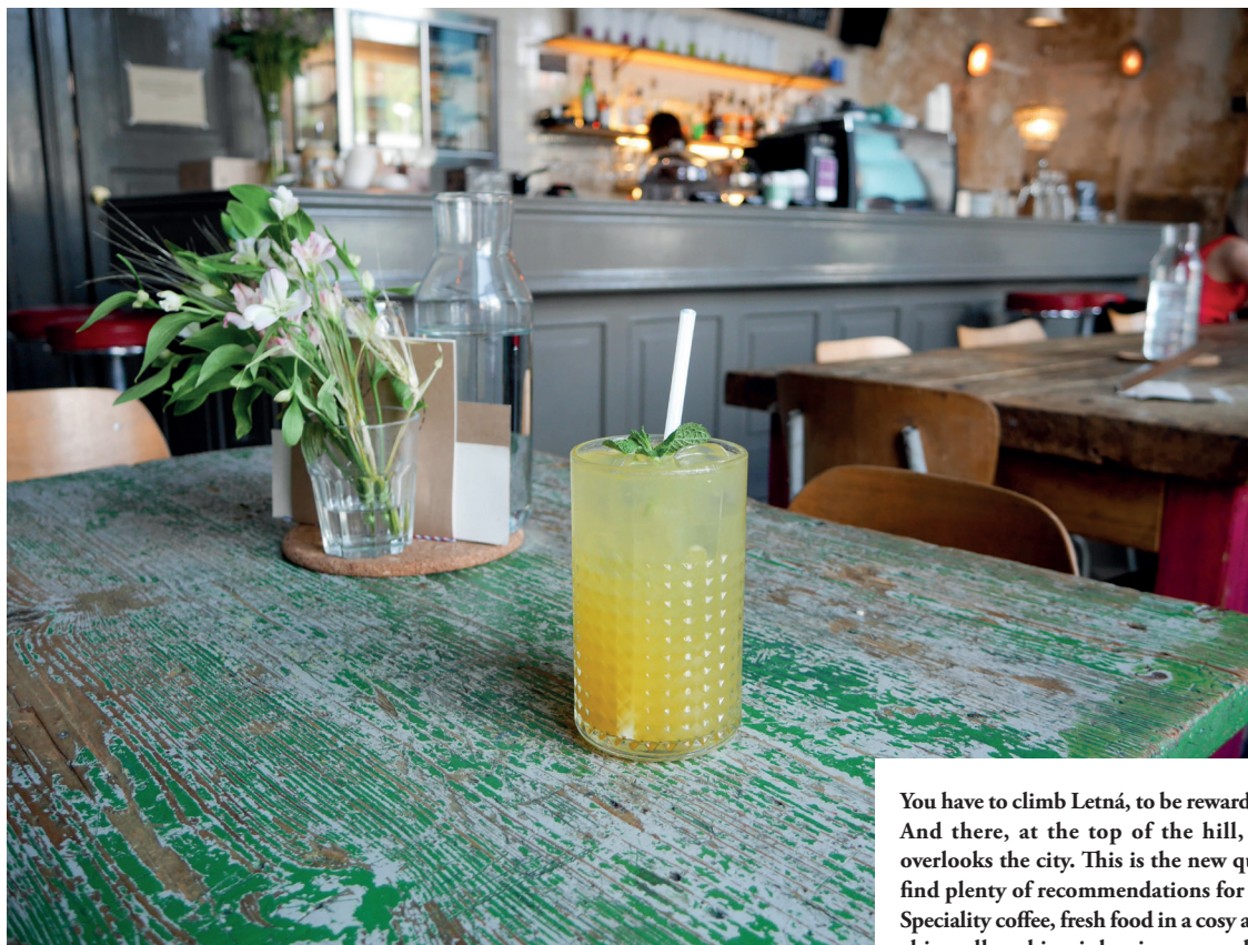
CAFÉ LETKA

You have to climb Letná, to be rewarded with café Letka. And there, at the top of the hill, a haven of peace overlooks the city. This is the new quarter where you'll find plenty of recommendations for places to stay. Speciality coffee, fresh food in a cosy atmosphere: shabby chic walls, a big pink mirror, wooden tables sporting bucolic bouquets... all this should convince you to make café Letka your HQ for your Prague stay.